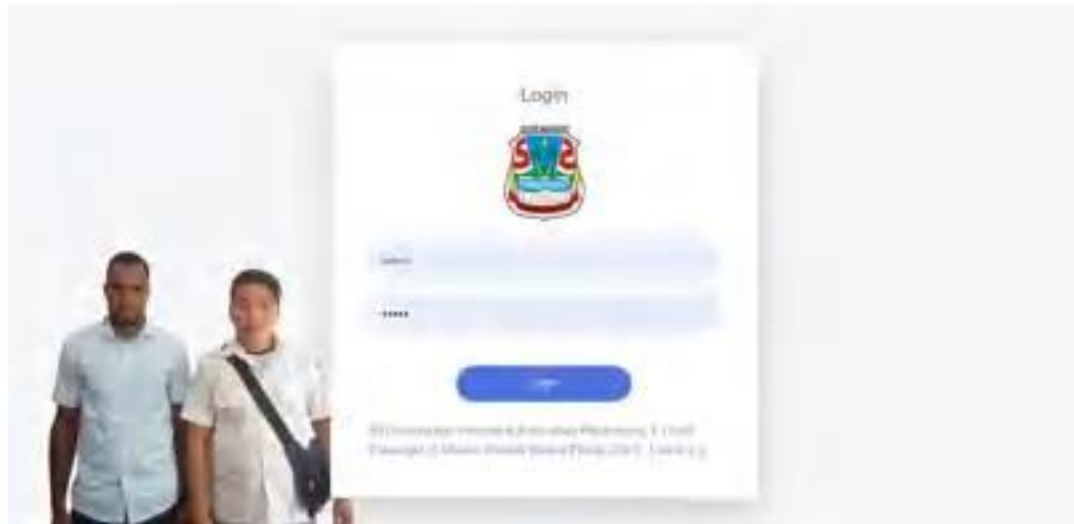
Gambar 4. Interface Login

Pada menu login menampilkan form input -an username dan password yang bertujuan sebagai akses untuk masuk mengelolah data-data pada sistem.