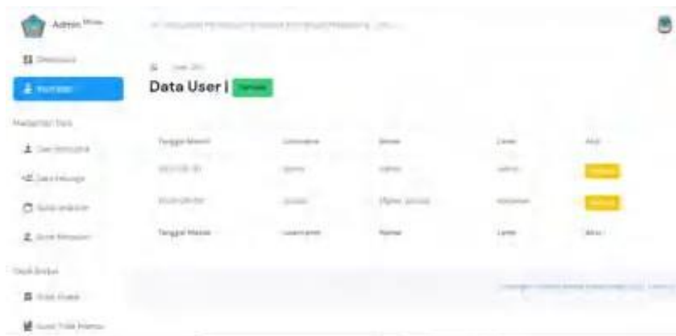
Gambar 7. Interface List User

Pada menu List User menampilkan data-data untuk menambahkan data-data user , baik user untuk admin dan karyawan.