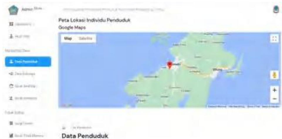
Gambar 8. Interface Data Penduduk

Pada menu Data Penduduk menampilkan data-data penduduk dengan dilengkapi dengan Geospasial posisi tiap penduduk.