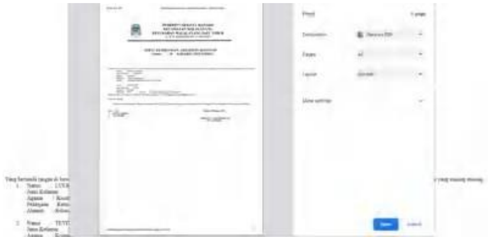
Gambar 11. Interface Cetak Data Surat Kematian

Tampilan cetak data kematian adalah menampilkan preview data yang akan dicetak nantinya.