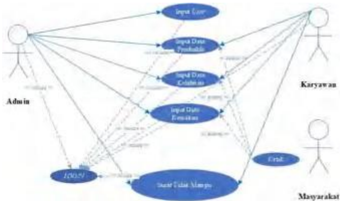
Gambar 3. Use Case Diagram Aplikasi Kependudukan

Use case diagram akan menjelaskan interaksi aplikasi dengan para aktor, sebagai berikut ini :