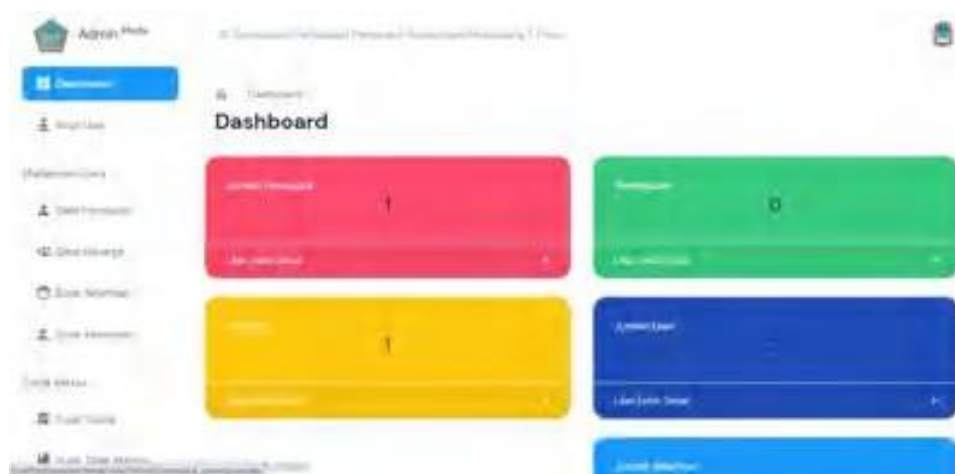
Gambar 5. Interface Dashboard

Pada menu dashboard menampilkan beberapa informasi mengenai data- data kependudukan baik jumlah penduduk, jumlah perempuan dan laki-laki serta jumlah user .