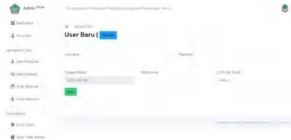
Gambar 6. Interface Tambah User

Pada menu Tambah User menampilkan data-data untuk menambahkan data user , baik user untuk admin dan karyawan.