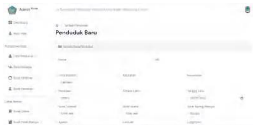
Gambar 9. Interface Tambah Data Penduduk

Pada menu tambah data penduduk adalah menu yang disediakan untuk menambahkan data baru penduduk, yang bertujuan untuk menyimpan data-data penting penduduk. Data yang ditambahkan pada menu ini akan langsung terkonfirmasi secara otomatis.