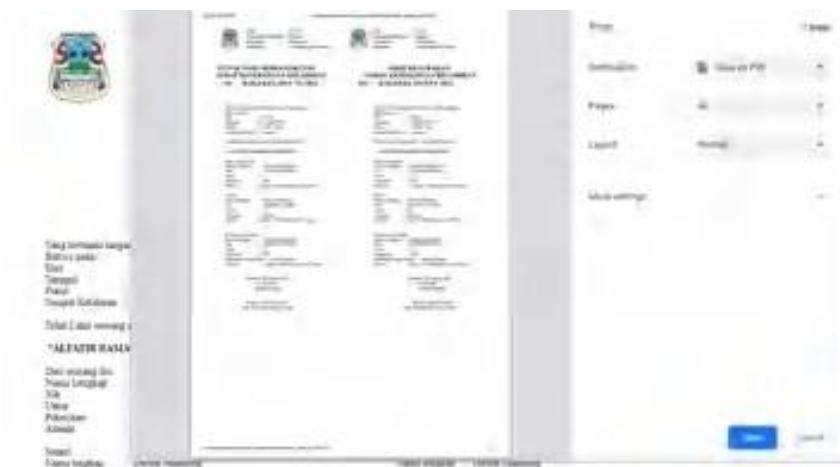
Gambar 11. Interface Cetak Data Surat Kelahiran

Tampilan cetak data kelahiran adalah menampilkan preview data yang akan dicetak nantinya.